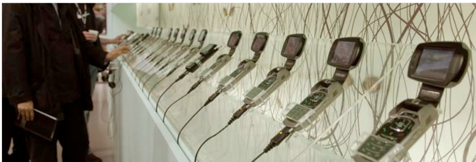
DMB-Handys am Stand von Samsung

Diskussionen um Handy-TV auf der CeBIT in Hannover